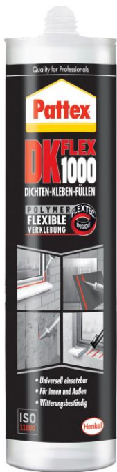
Das Multitalent: Pattex DK Flex 1000