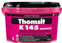
Thomsit K 145 DesignTack (Thomsit 13).