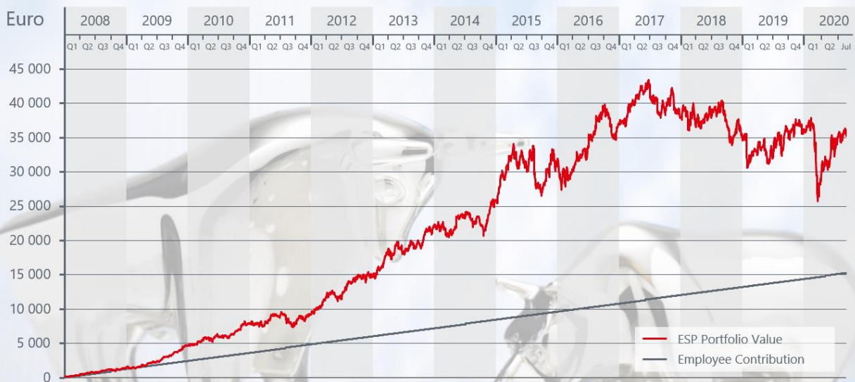
Development of the share portfolio of an employee investing 100 EUR per month from 2008 until end of July 2020