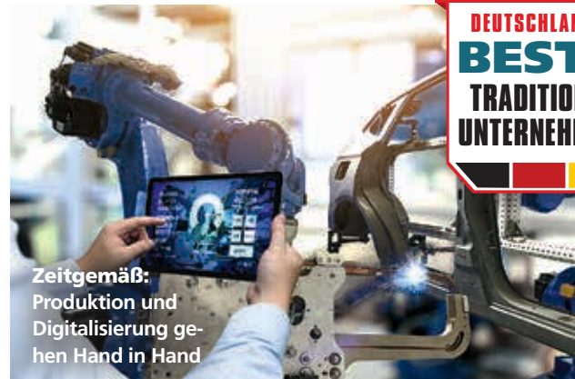
Zeitgemäß: Produktion und Digitalisierung gehen Hand in Hand