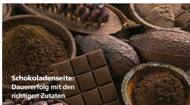
Schokoladenseite: Dauererfolg mit den richtigen Zutaten