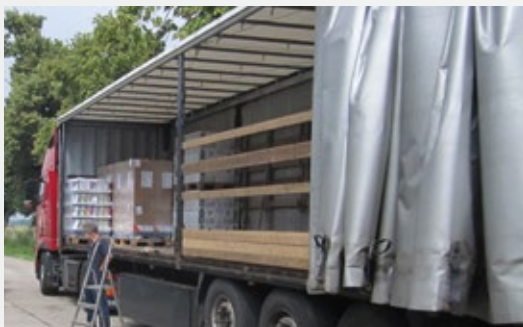
Henkel je distribuirao 70 paleta proizvoda ljudima u regionima pogođenim poplavama.

Odgovoran za brend i korporativni angažman i hitnu pomoć u Henkel sektoru za Globalni društveni napredak.