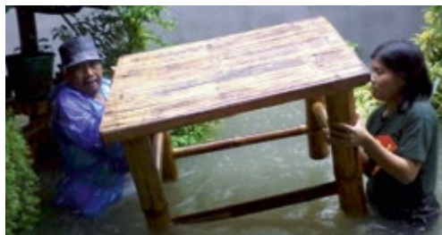
Spasavaju sve što mogu: Porodica zaposlene Jenette Reyes za vreme poplava u Manili u avgustu 2013.

Henkelovi zaposleni su takođe bili pogođeni poplavama. Fondacija Fritz Henkel je pritekla odmah u pomoć nudeći praktičnu pomoć. Na primer, kompanija je ponudila alternativni smeštaj za porodice pet zaposlenih koje su bile pogođene poplavama. Takođe, zaposleni koji posle posla nisu mogli da stignu kući, imali su obezbeđen smeštaj i mogli su da provedu noć u hotelu. „Za vreme oluje, naši zaposleni su uradili sve što su mogli kako