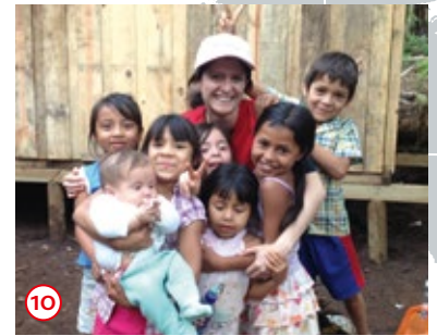
Gvatemala: Pomoć je obezbeđena za više od 30 porodica iz Gvatemale zahvaljujući MIT projektu realizovanom u saradnji sa organizacijom „Un Techo Para mi País” (Krov za moju zemlju). U avgustu 2012, organizacija je izgradila pet stambenih jedinica u oblasti Barberena. Ljudi tamo žive u velikom siromaštvu. Zaposleni u Henkelu i njihove porodice i prijatelji pomogli su da se izgrade kuće. www.techo.org