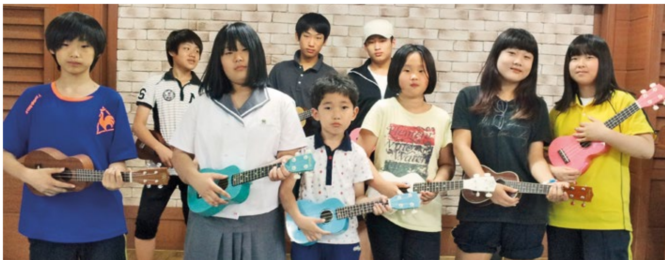
Časovi muzike za decu i mlade: „Henkel CARE Team” već godinama podržava projekte za decu i porodice iz socijalno ugroženih grupa u Južnoj Koreji. Ova MIT posebna donacija će im omogućiti da prošire svoju posvećenost.

„Uz ovu podršku, želimo da pokrenemo program mentorstva koji će, nadamo se, pomoći mnogima – deci i mladima da se bolje integrišu ovde u Južnoj Koreji, uprkos kulturnim razlikama u odnosu na zemlju iz koje potiču.”