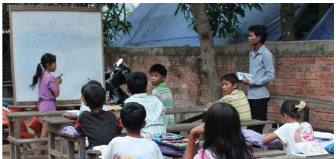
Časovi u „Khmer For Khmer Organization“ (KFKO) dečjem domu u Sijem Reapu, Kambodža.